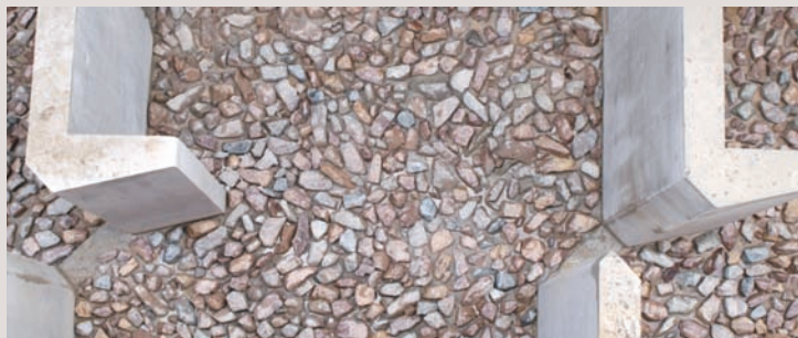
→ Passe à poissons de Chatou vue de dessus.

Quand les obstacles aux mouvements des poissons ne peuvent être éliminés, notamment quand il s'agit d'ouvrages hydrauliques en exploitation, le rétablissement de la continuité écologique est obtenue par des passes à poissons. Ce sont des équipements destinés à accompagner les poissons dans leur remontée du courant, adaptés aux caractéristiques de chaque espèce.