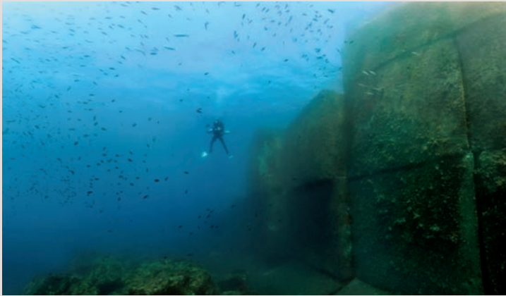
→ À Marseille, la nature a trouvé refuge dans la mer.