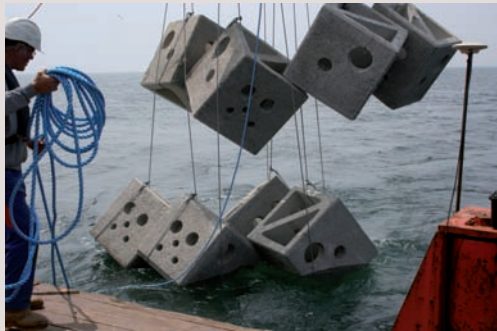
→ Immersion de caissons de 1,5 m de côté.