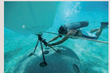
→ Pose de récifs avec une barge au large de Cagnes-sur-Mer.