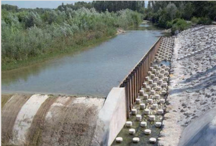
→ La passe à poissons sur le Roubion.

Chaque situation exige une réponse particulière. Il y a donc, à partir des grands types de passes à poissons, une infinité d'ouvrages différents, étudiés et réalisés en fonction d'une analyse fine du contexte et des objectifs poursuivis. L'éventail est large, entre les grandes passes à poissons sur les fleuves, comme celle de Gamsheim sur le Rhin, et de nombreuses autres plus modestes,