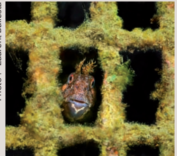
→ Un refuge en béton pour la blennie.