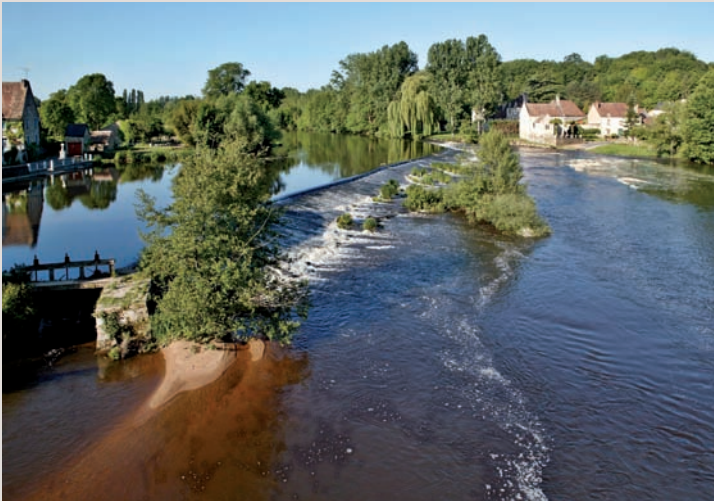
→ Chaussée déversoir de Saint-Pierre-de-Maillé sur la Gartempe.

Il s'agit ici de la « trame bleue », sœur jumelle et inséparable de la « trame verte », née de la loi Grenelle 1 (article 24), au titre de la biodiversité. La trame bleue concerne les rivières et autres zones humides. Les cours d'eau constituent des couloirs pour la vie aquatique, mais aussi pour la vie de nombreux animaux qui leur sont inféodés, notamment les amphibiens, et ceux qui colonisent les berges. Les obstacles à l'écoulement des eaux peuvent entraîner une série de dérèglements, tels que la hausse de la température et des proliférations algales, avec des conséquences sur toute la vie aquatique et subaquatique. Depuis l'antiquité, les rivières ont été aménagées. Tantôt pour qu'elles deviennent franchissables, tantôt pour produire de l'énergie, rendre possible la navigation, prélever et stocker de l'eau pour les besoins humains et l'irrigation, lutter contre des inondations, créer des étangs